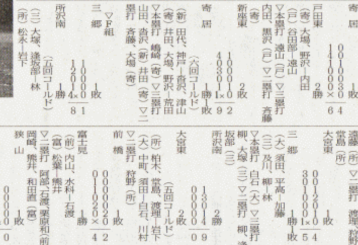
D組 上尾一新座 3回裏新座2死二、三塁、明石が右中間にタイムリー三塁打を放ち、逆転

春日部 2勝 0.05 飯能東 1勝 飯能西 1勝 飯能南 1勝 飯能北 1勝 飯能中 1勝 飯能東 1勝 飯能西 1勝 飯能南 1勝 飯能北 1勝 飯能中 1勝 飯能東 1勝 飯能西 1勝 飯能南 1勝 飯能北 1勝 飯能中 1勝 飯能東 1勝 飯能西 1勝 飯能南 1勝 飯能北 1勝 飯能中 1勝