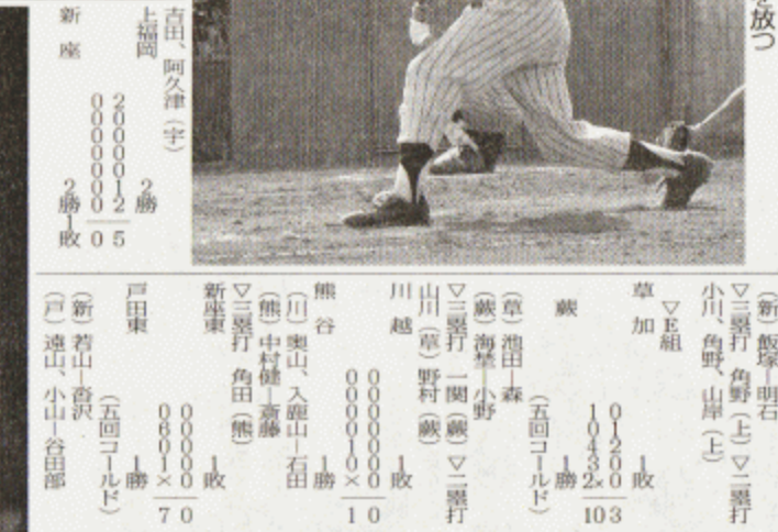
C組 所沢中央一白岡 3回表所沢中央1死二塁、高橋が中前にタイムリーを放つ

春日部 2勝 0.08 飯能東 1勝 飯能西 1勝 飯能南 1勝 飯能北 1勝 飯能中 1勝 飯能東 1勝 飯能西 1勝 飯能南 1勝 飯能北 1勝 飯能中 1勝 飯能東 1勝 飯能西 1勝 飯能南 1勝 飯能北 1勝 飯能中 1勝 飯能東 1勝 飯能西 1勝 飯能南 1勝 飯能北 1勝 飯能中 1勝